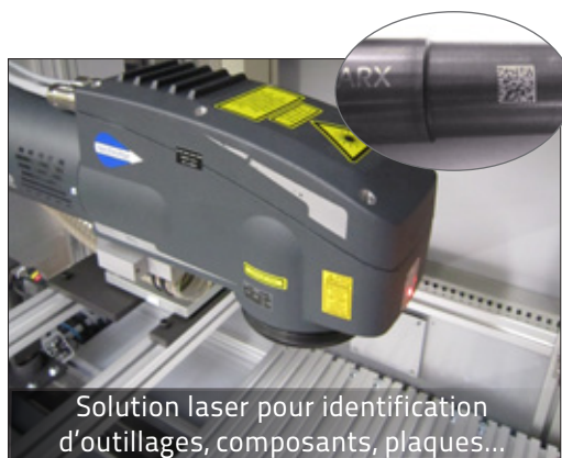
Solution laser pour identification d'outillages, composants, plaques...