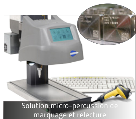
Solution micro-percussion de marquage et relecture

Savoir-faire... Technifor est le premier fabricant mondial de machines de marquage permanent pour la traçabilité et l'identification automatique de pièces métalliques et plastiques.