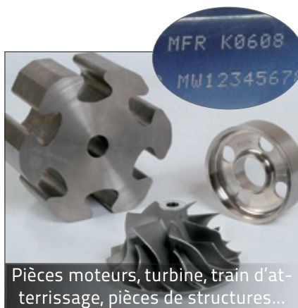
Pièces moteurs, turbine, train d'atterrissage, pièces de structures...